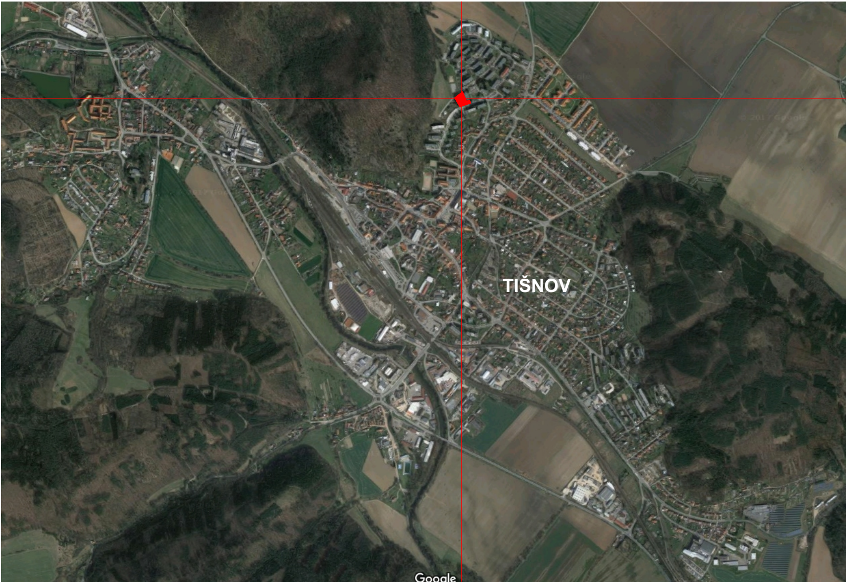
SITUACE V RÁMCI TIŠNOVA